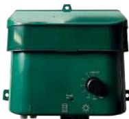
Vandingsmodul / Bevattningsmodul