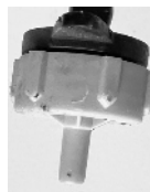
Dryp mundstykke / Droppmunstycke