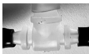
T-stykke transperant med klar og sort slang / T-stykke transparent med svart och klar slang