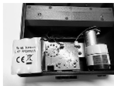
Batteri, Print og pumpe / Batteripaket med pump och PCB