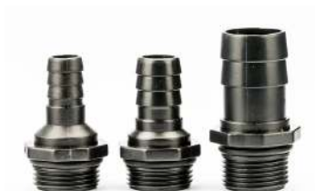
Slangekoblinger med 1" gevind til 12/16/25 mm slange. Slangkopplingar med 1" gänga till 12/16/25 mm slang.