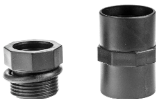
Gvindreduktionsring 1" udv/indv og 1" Muffe Gängad reduceringsring 1" utv/inv och 1" gängad invändig sockel