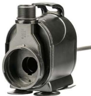
Pumpemotor / Pumpmotor