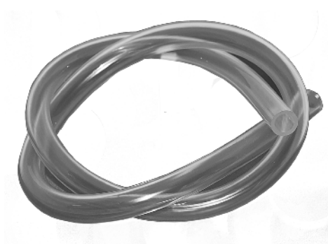
Plastslange / Plastslang