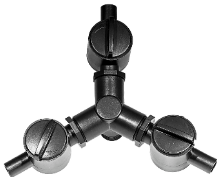
Tre-vejs fordeler / Trevägskran