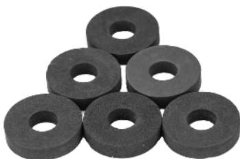
Neoprenpakninger / Tätningrings