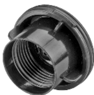
Rotorlåg / Rotorlock