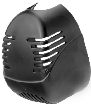
Filterdæksel / Filterkåpa