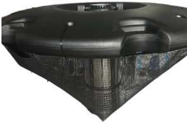
Flydering med monteret net / Flytring med monterad net