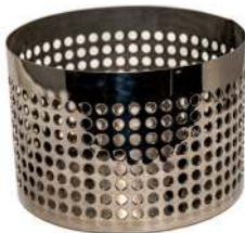
Bund / Botten