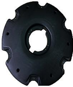
Flydering / Flytring