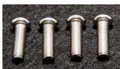
Skruel til låselkrave / Skruvar till låselkrage