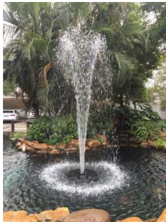
Cascadedyse / Kaskadmunstycke