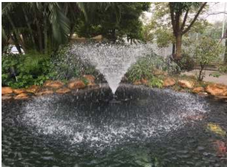
Tulipandyse / Tulpanmunstycke