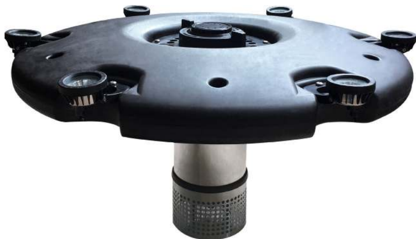
Flydende pumpe 60000 med lys Flytande pump 60000 med ljus