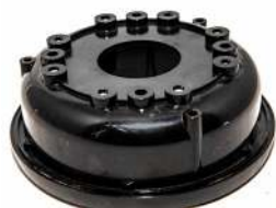
Rotorlåg / Rotorlock