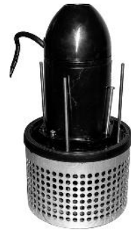
Pumpe uden dæksel / Pumpe utan kåpa