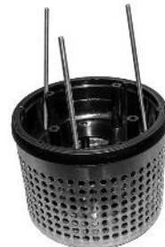
Bund med lange skruer og rotorlåg / Botten med långa skruvar och rotorlock