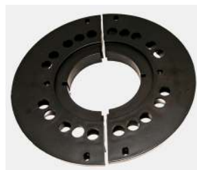
Låselkrave / Låselkrage