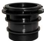
Samlestykke / Fåstring pump