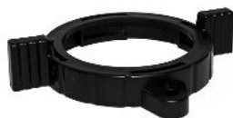
Låseling til fontænedysel / Låseling till munstycken