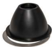
Tulipandysel / Tulpanmunstycke