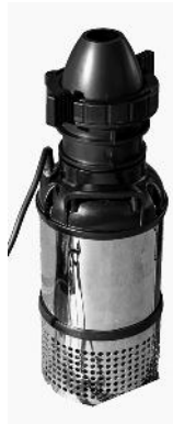
Pumpe / Pump