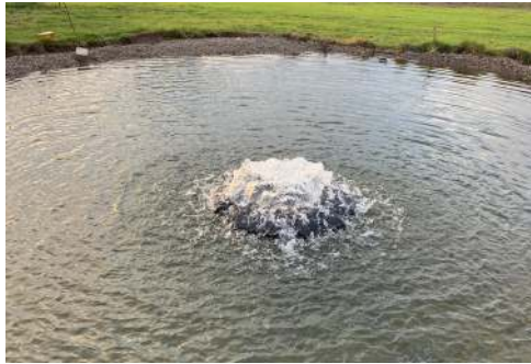
Uden fontænedyse / Utan fontänmunstycke