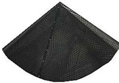
Net / Nät