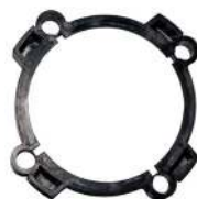
Låseling til rotor / Låseling till rotor