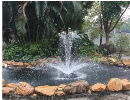
Vukandyse / Vulkanmunstycke