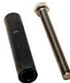
Skruer til bund / Skrugar till botten