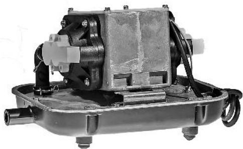
Pumpeblok mm. på bundplade. Metallkammare m.m. på bottenplattan.