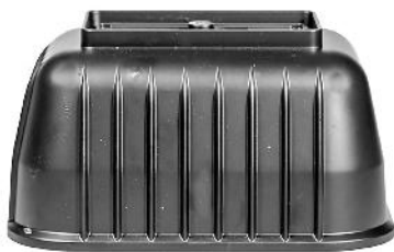
Topdæksel. Luftpumps locket.