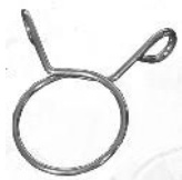
Slangeklemme / Slangklämma