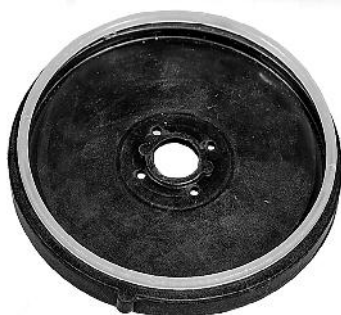
Gummimembran med låsering. Gummimembran med den vita låseringen.

PondTeam är med i Elkretsen för miljösäker återvinning och REPA när det gäller emballage.