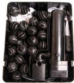
Filter uden låg / Filter utan lock monterat