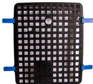
Filterlæg med clips / Filterkåpa med clips