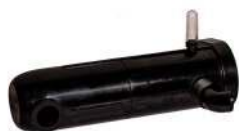
Art.nr. 40668 UV-hus