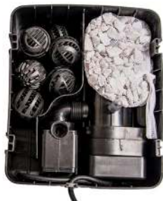
Filter uden låg Filter utan lock monterat