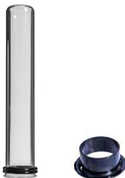
Art.nr. 40663 Kvarrtglas m. 2 o-ringe og afstandspakning / Kvarrtglas m 2 o-ringar och distanspackning