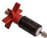
Art.nr. 30815 Rotor