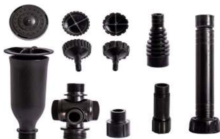
Art.nr. 30444 Dysesæt CC 3000+5500 / Fontänset CombiClear 3000+5500