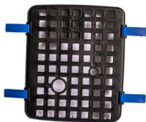
Filterlåg med clips Filterkåpa med clips