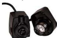
Art.nr. 40661 El-enhed / Elenhet Pump/UV