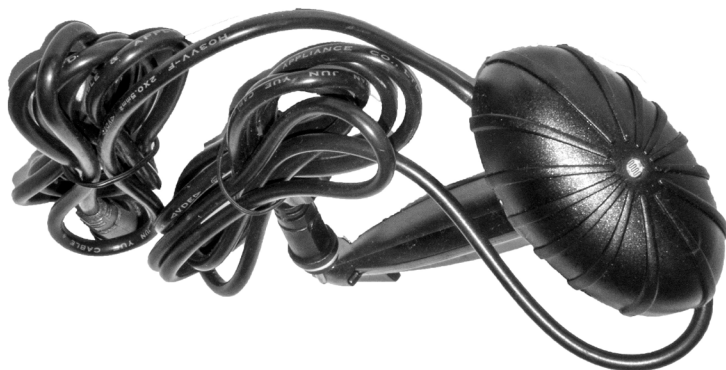
Lyssensor / Ljussensor

En defekt Aqualight LED 12 får inte slängas bland vanliga sopor utan behandlas som elavfall och lämnas på ex.vis en miljöstation. Pondteam är medlem i elkretsen för en hållbar elåtervinning och REPA när det gäller emballage.