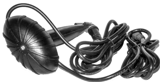
Lyssensor / Ljussensor

En defekt LED Spot Power 3 W får inte slängas bland vanliga sopor utan behandlas som elavfall och lämnas på ex.vis en miljöstation. Pondteam är medlem i elkretsen för en hållbar elåtervinning och REPA när det gäller emballage.